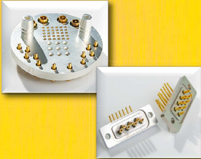
Pièces à l'attache